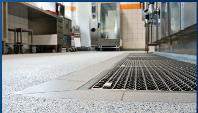
Entwässerung in einer Großküche