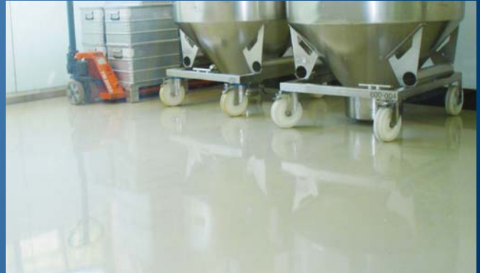
Reinraumbeschichtung in der Pharmaindustrie

Die Produktion von Lebensmittel und Pharmazeutika stellt höchste Anforderungen an Anlagentechnik und bauliche Ausrüstung. Insbesondere der Bodenbelag muss komplexe Funktionen erfüllen, z. B. Hygiene und Arbeitssicherheit gewährleisten.