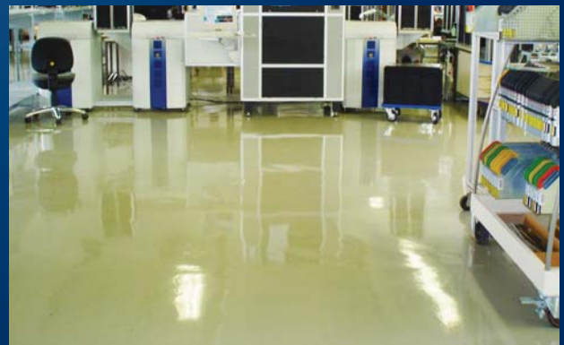
ESD-Bodenbeschichtung für die Produktion von elektronischen Bauelementen